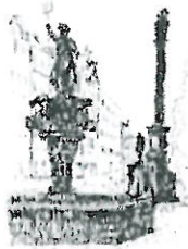
Rynek Fontanna z Neptunem